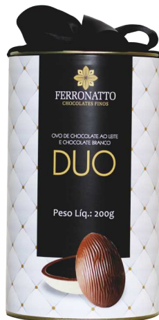
Ovo Duo Chocolate Ao Leite e Branco - 200g Ref.: 220 - cx 6uni