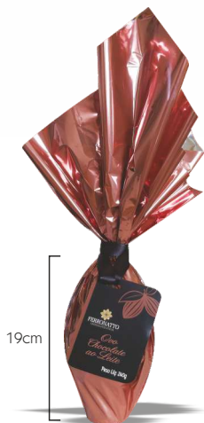
Ovo Chocolate ao Leite - 240g Ref.: 254 - cx 9uni