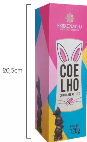
Coelho de Chocolate ao Leite - 120g Ref.: 810 - cx 15uni