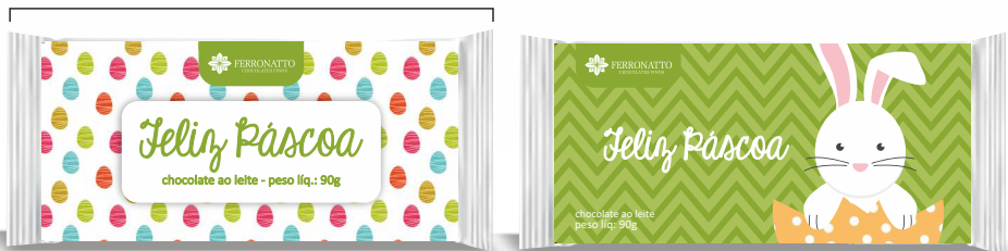
Placa de Chocolate ao Leite - 90g Ref.: 90 - cx 12uni