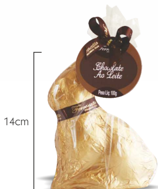
Lebre de Chocolate ao Leite - 100g Ref.: 1967 - cx 12uni