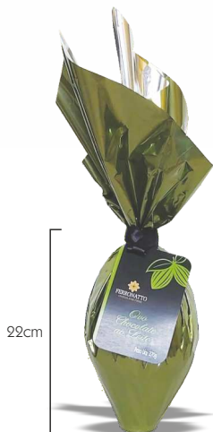
Ovo Chocolate ao Leite - 370g Ref.: 372 - cx 8uni