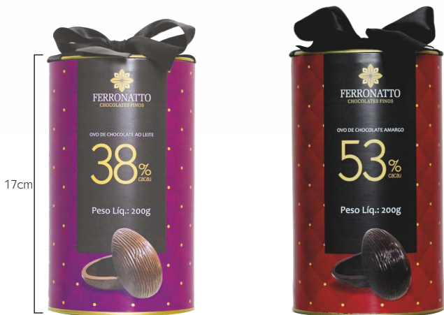
Ovo de Chocolate Ao Leite 38% Cacau - 200g Ref.: 228 - cx 6uni