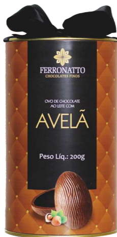
Ovo Chocolate Ao Leite com Avelã - 200g Ref.: 218 - cx 6uni