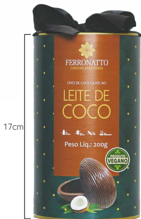
Ovo de Chocolate ao Leite de Coco - 200g Ref.: 206 - cx 6uni