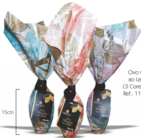
Ovo Chocolate ao Leite - 100g (3 Cores de Papéis) Ref.: 110 - cx 20uni