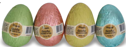
Ovos de Chocolate ao Leite - 35g Ref.: 180 - cx 32uni (cores sortidas)