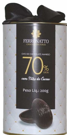
Ovo de Chocolate Amargo 70% Cacau com Nibs de Cacau - 200g Ref.: 226 - cx 6uni