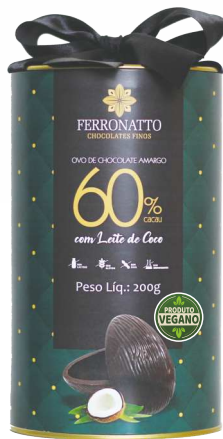
Ovo de Chocolate Amargo 60% Cacau com Leite de Coco - 200g Ref.: 232 - cx 6uni