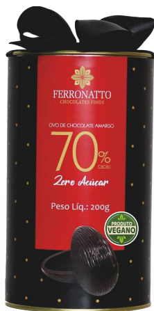
Ovo de Chocolate Amargo 70% Cacau Zero Açúcar - 200g Ref.: 234 - cx 6uni