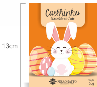
Coelho de Chocolate ao Leite - 50g Ref.: 55 - cx 16uni