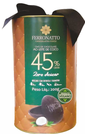
Ovo Chocolate Ao Leite de Coco 45% Cacau Zero Açúcar - 200g Ref.: 236 - cx 6uni